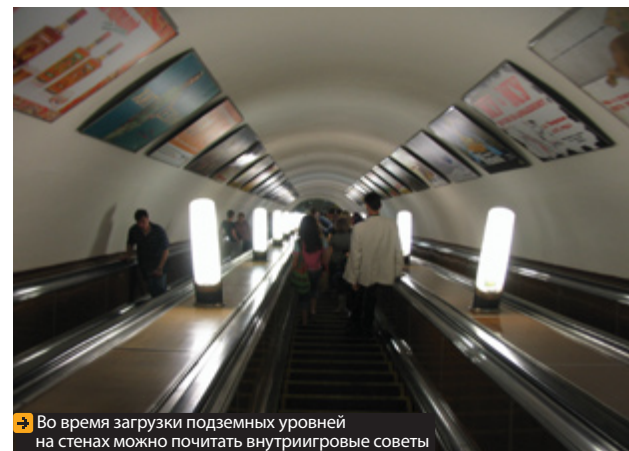
Во время загрузки подземных уровней на стенах можно почитать внутриигровые советы