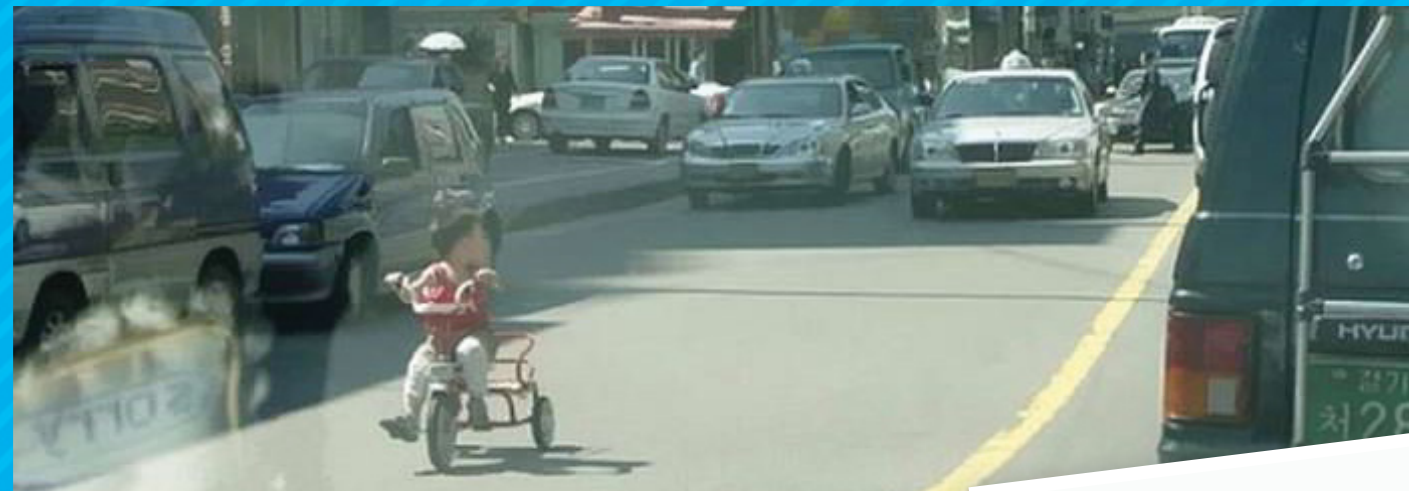
«Возврат во времени». Игрок оглядывается назад, чтобы не задеть машины