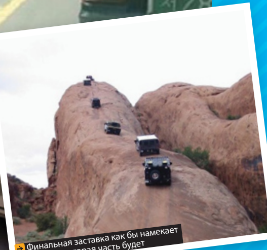
Финальная заставка как бы намекает на то, что вторая часть будет