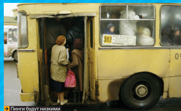
Пинги будут низкими