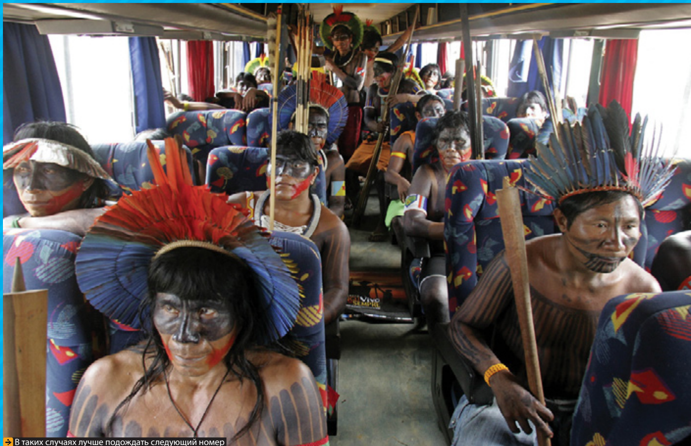
В таких случаях лучше подождать следующий номер