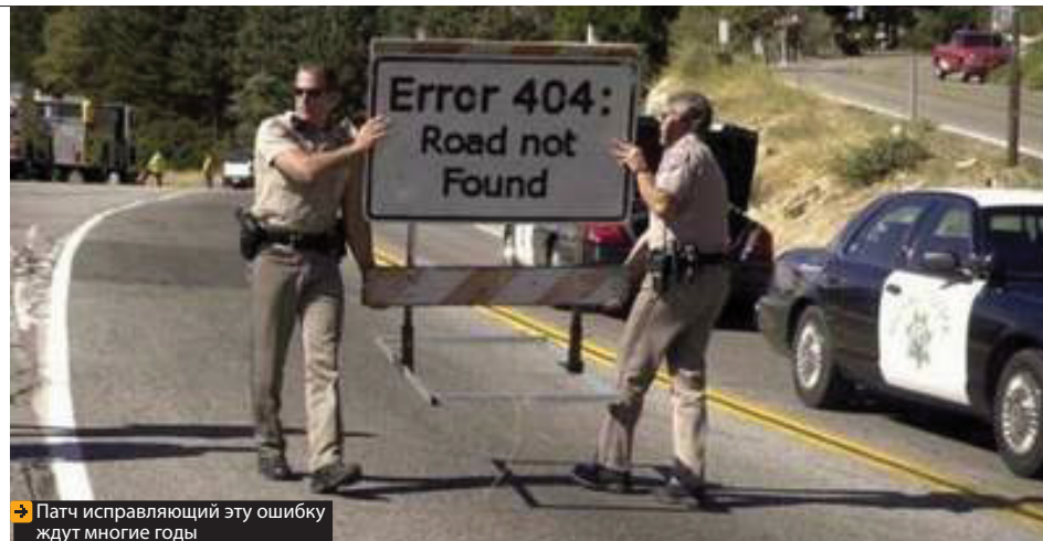
Патч исправляющий эту ошибку ждут многие годы

Интерфейс во многом напоминает WoW, поэтому часто используемые фразы «под ноги смотри», «куда лезешь?», «самый умный?» и другие лучше сразу повесить на быстрые клавиши. Слишком часто грубить однако не стоит, такое поведение может временно переключить камеру с видом от первого лица на неудобный вид от одного глаза.