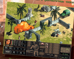
Приобретай оружие прямо на поле боя

Б езжалостная королева узурпировала власть в маленькой, но богатой стране. Огромная, хорошо вооружённая армия держит народ в железном кулаке страха, единственная оппозиция тирании — маленькая группа повстанцев. Хорошая новость: ты должен заботиться о повстанцах. Хорошая новость: лучшие наёмники со всего мира будут на твоей стороне... Если у тебя хватит на них денег. Впереди кровавая битва за свободу. Для победы ты должен быть блистательным дипломатом, гениальным военным стратегом и непревзойдённым тактиком ведения боя.