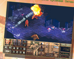
Глубкий игровой сценарий. Выбор между реалистичным и фантастическим типом