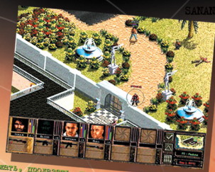
Бегать, пролезать, полети сквозь кровавые сны.

Jagged Alliance 2 Агония Власти Copyright © 1999 Sirtech Canada, Limited. Все права защищены. © 1999 Все права на локализацию и издание на территории России, Стран бывшего Советского Союза принадлежат компании "Бука". Jagged Alliance® - зарегистрированная торговая марка 1259191 Ontario Inc. Все прочие торговые марки являются собственностью их владельцев и употребляются без указания статуса торговой марки.